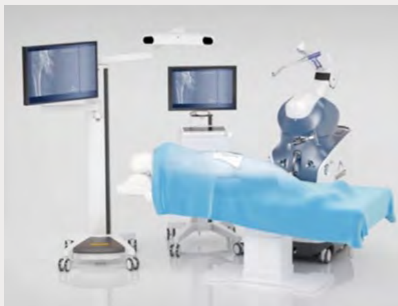
機器設置イメージ