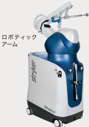
ロボティックアーム

従来の手術ナビゲーションの技術をさらに進化させ、術中の手術器械の位置を表示しながら正確な位置へ誘導します。また、コンピューター制御されたロボティックアームが治療計画外の範囲にさしかかると自動的にストップして患部周辺組織を保護。血管や神経の損傷などの合併症を防ぐことができ、正確で安全な手術を可能にします。